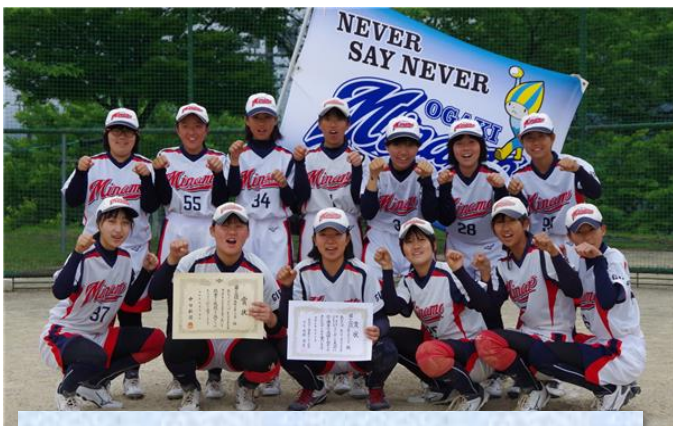
第3位 大垣ミナモジュニア