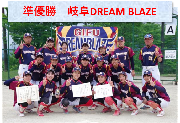
準優勝 岐阜DREAM BLAZE