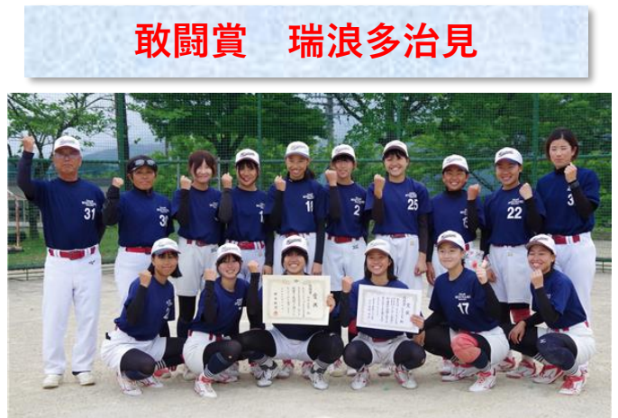
敢闘賞 瑞浪多治見