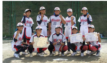
第2位 大垣ミナモソフトボールジュニアクラブ